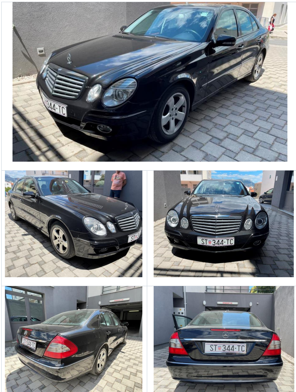
Slike 1. do 10.: Prikaz općeg stanja automobila i oštećenja koja su označena strelicama